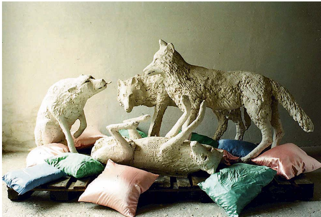
„Die Dresdner Gruppe“ ist aus Gips und Seidenkissen gestaltet.