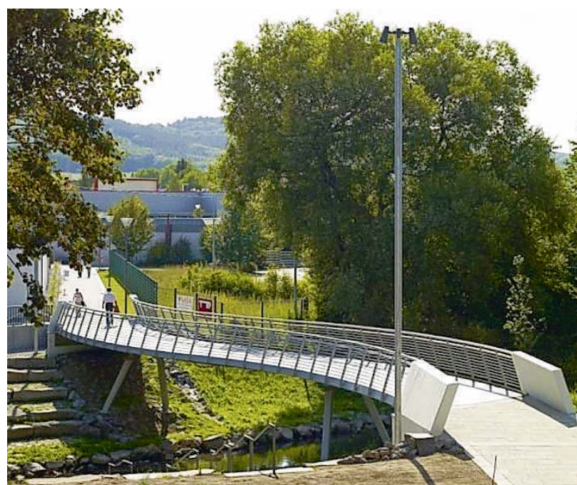
Die Brücke über die Theel in Lebach, ein Projekt des Homburger Büros Rollmann & Partner ist eines von drei Angeboten am „Tag der Architektur“ im Landkreis Saarlouis.

Dieser Empfehlung folgten am „Tag der Architektur“ der vergangenen Jahre, so der Kammerpräsident mit Blick auf die Statistik, jeweils rund 1000 Menschen. sg